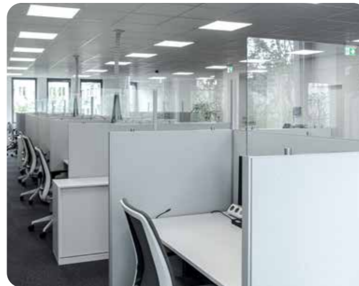
Oben: Prime Line 55 Tischelement mit Glasaufsatzblende Unten: Prime Line 40 Stellwand- und Tischelemente mit Glasaufsatzblenden