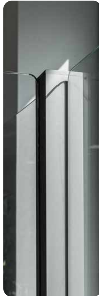
T-Kombination von Elementen mit Glasaufsatzblende

Die Serien Prime Line und Silence Line bieten vielfältige Ausstattungsvarianten. Dazu zählt die Aufrüstung von Tischelementen und Stellwandelementen mit Ganzglasblenden zur Erhöhung der schirmenden Wirkung unter Beibehaltung der im Raum gewünschten Blickachsen. Akustik und Sicherheit gehen sozusagen Hand in Hand und können so sehr effizient gestaltet werden. Insbesondere für Raumsituationen die einen hohen Schutzschirm erfordern sind die Stellwandssysteme mit ihren im Rahmen gefassten Verglasungen bestens geeignet.