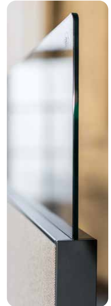
Silence Line Element mit Glasaufsatzblende