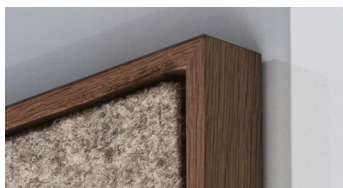
Rahmen Massivholz - Nussbaum