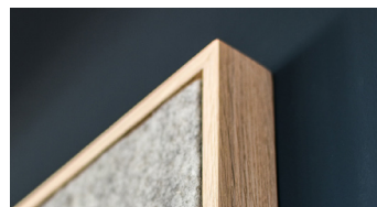
Rahmen Massivholz - Eiche