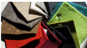
Schurwollfilz - Farbauswahl